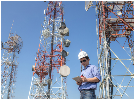
परिसरातील नागरिकांकडून व्यक्त केली जात आहे.

घरबसल्या होत आहेत. मोशी प्राधिकरणाचा परिसर असूनही मोबाईल नॉट रिचेबल ची समस्या येते आहे. परिसरात वायफाय (इंटरनेट) केबलवाल्यांची चांगलची चलती आहे. प्रत्येकाला इंटरनेटचा प्लॉन घ्यावाच लागतो. त्याशिवाय मोबाईल वापरणे अशक्य होते. राजकारण्यांची इच्छाशक्ती असती, तर आतापर्यंत महापालिकेकडून दीड ते दोन गुंठे जागा मिळवून मोबाईल टॉवर उभारून अनेकांची समस्या मार्गी लागली असती. मात्र राजकाण्यांची इच्छाशक्ती नसल्यामुळे आतापर्यंत मोबाईल टॉवर उभारण्यात आला नसावा अशी खंत